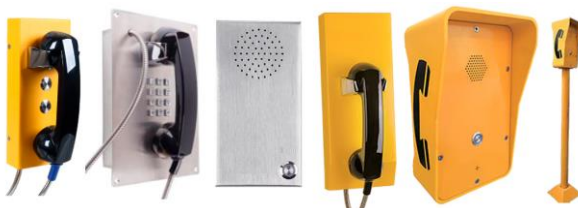
Ejemplos de aplicación