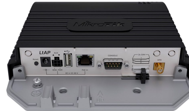
LtAP LTE6 kit