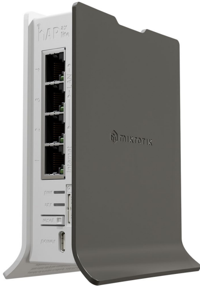
hAP ax lite LTE6