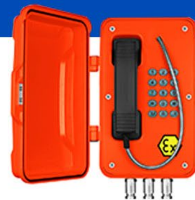
A prueba de explosiones