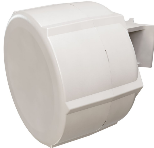
SXT LTE6 kit